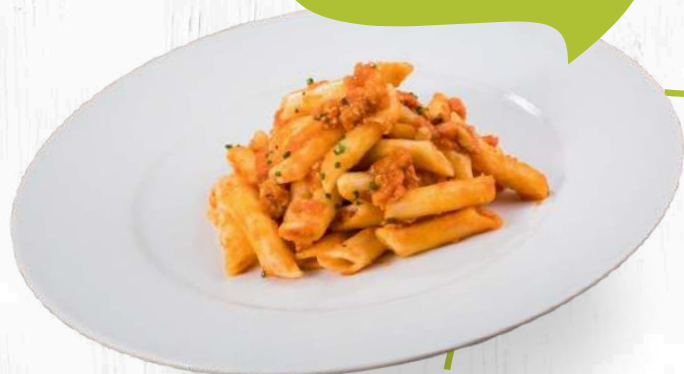
MACARRONS BOLONYESA (380 grams)