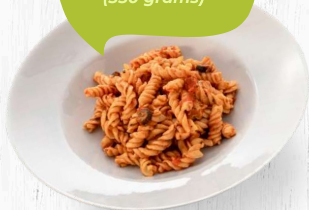
FUSILLI ALLA PUTTANESCA (350 grams)