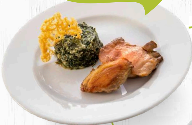
POLLASTRE & SUAU D'ESPINACS (370 grams)