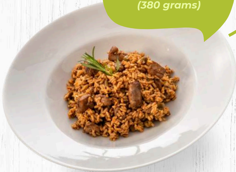
ARRÒS MUNTANYA (380 grams)