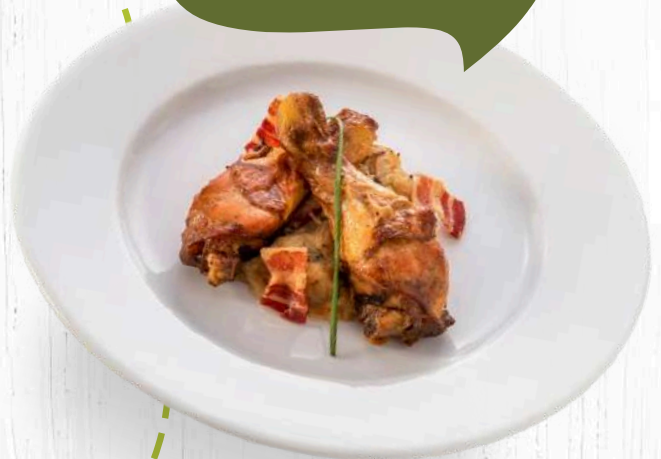
POLLASTRE & TRINXAT (400 grams)