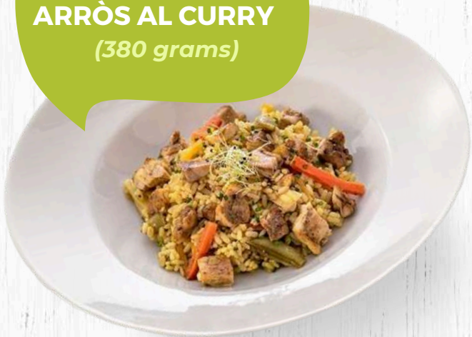
POLLASTRE & ARRÒS AL CURRY (380 grams)