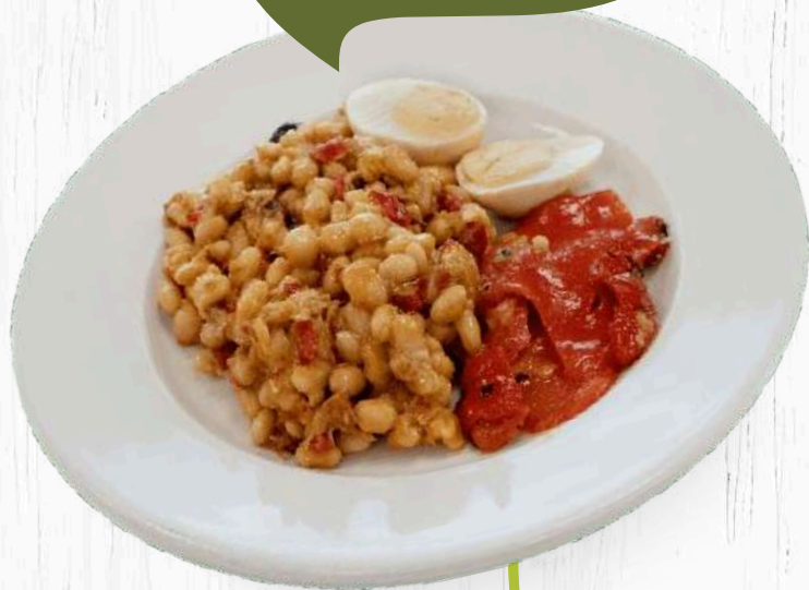
EMPEDRAT DE TONYINA (380 grams)