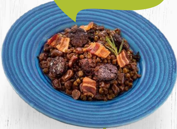
FAVES I PÈSOLS A LA CATALANA (350 grams)