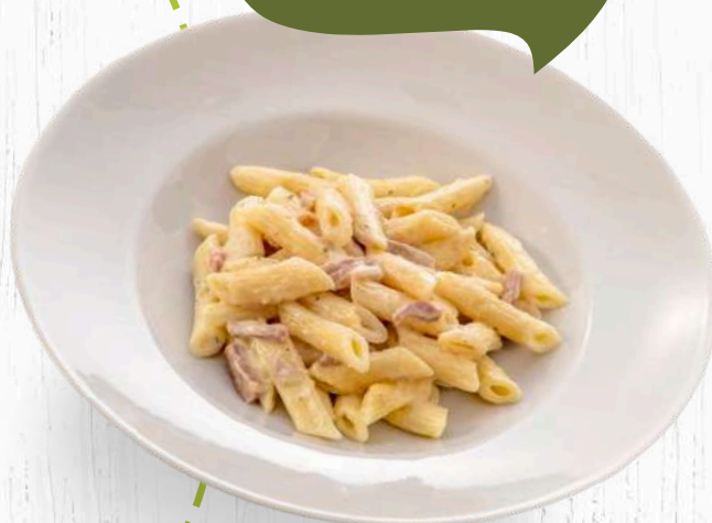
MACARRONS CARBONARA (380 grams)