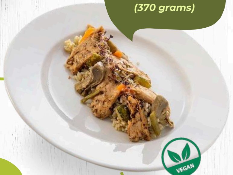
HEURA & ARRÒS AMB VERDURETES (370 grams)