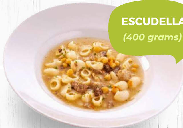
ESCUDELLA (400 grams)